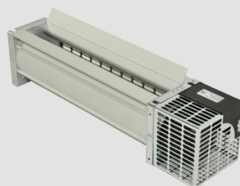
ASK80-370 (KOD 1ASK80370)